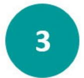
වෘත්තීය ක්‍රියාකාරී සැලැස්ම