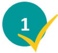
පරීක්ෂණයට මුහුණ දෙන්න

සෑම කෙනෙකුටම මෙම ගැටළු ඇති අතර සෑම කෙනෙකුටම සහාය මගින් ජර්නලාභ සලසා ගත හැකිය. මෙම ක්‍රියාවලියේදී ඔබට සහාය වීම සඳහා අපගේ වෘත්තීය උපදේශකවරයෝ පූර්ණ සුදානමින් පසුවෙති.